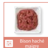
Bison haché maigre